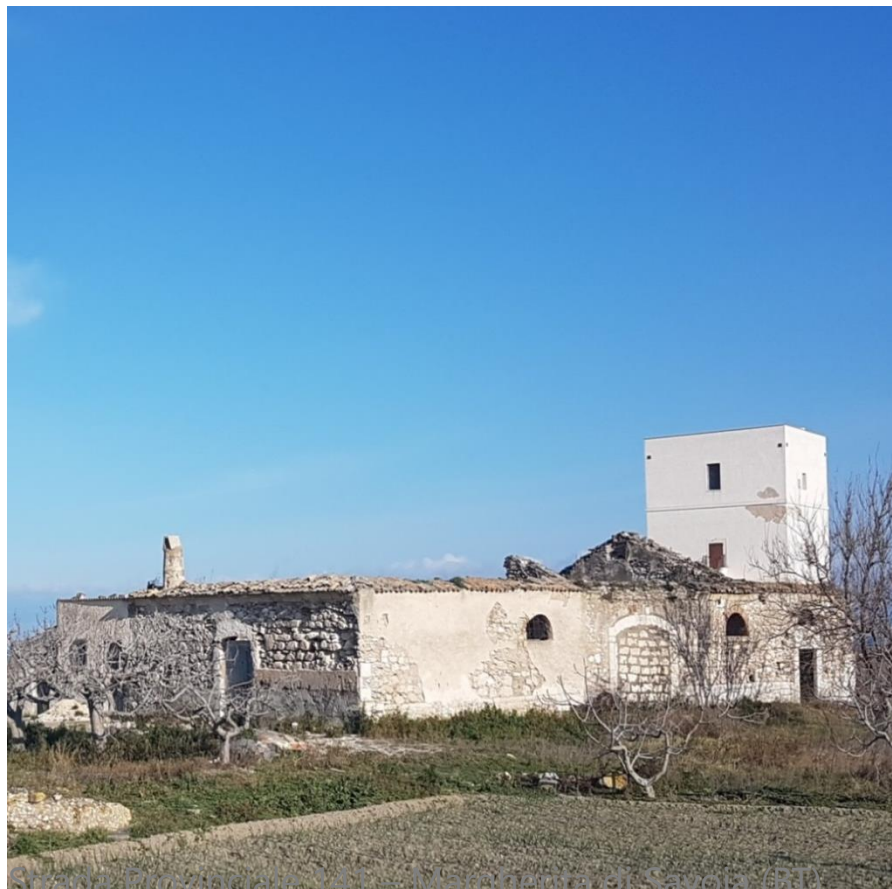
Strada Provinciale 141 - Margherita di Savoia (BT)