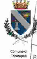
Comune di Trinitapoli